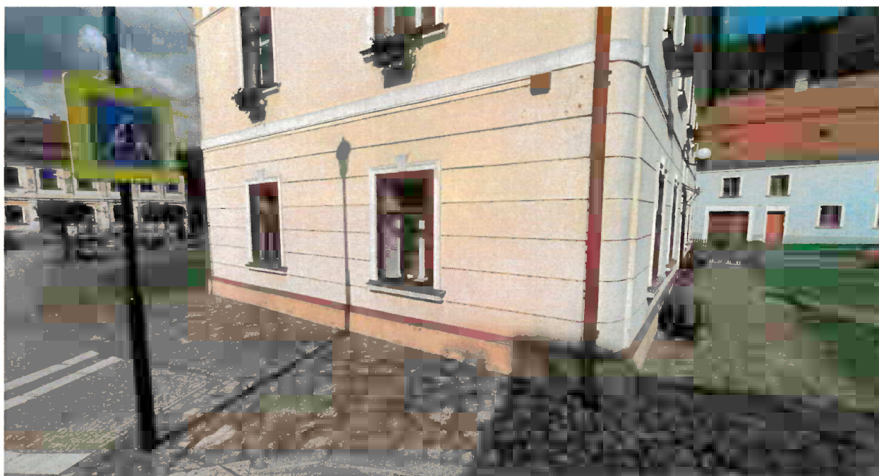
Obr. č. 2 Příklad rozvolněné dlažby s širokými spárami – okolí budovy čp. 162 v Jimramově