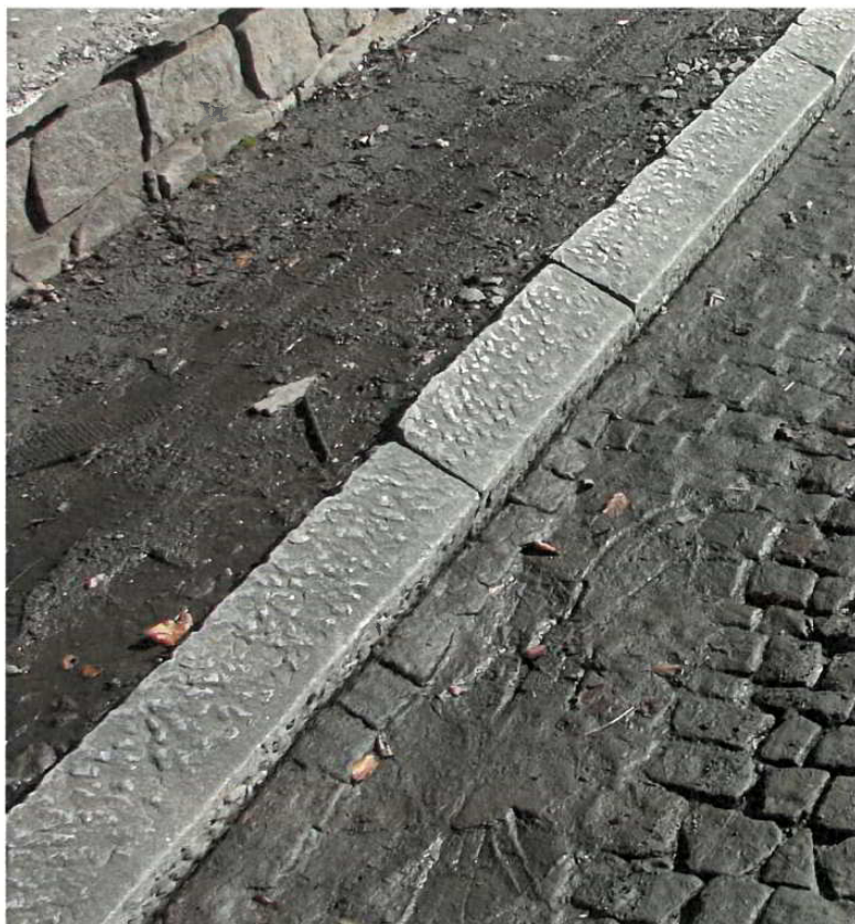
Obr. č. 1 Příklad hruběji opracovaného obrubníku z Jimramova